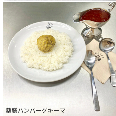
薬膳ハンバーグキーマ