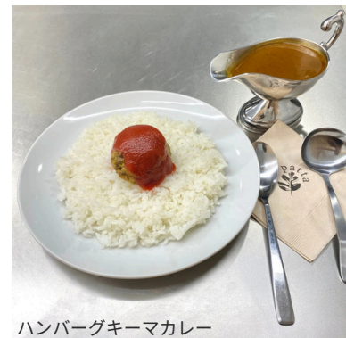
ハンバーグキーマカレー