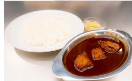
カシミールカレー